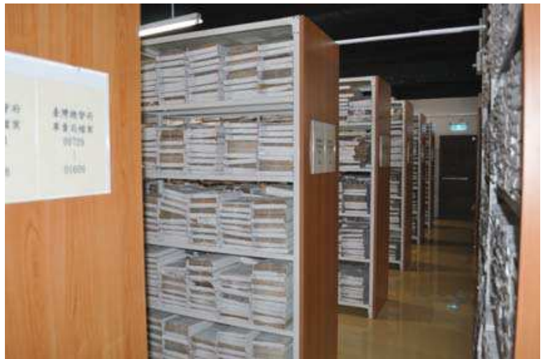
圖 1-2 文獻大樓 2 樓日治時期檔案庫房，「臺灣總督府檔案」即存放於此。

臺灣總督府檔案起迄年代為明治 28（1895）年至昭和 21（1946）年；檔案數量共 13,146 冊。其整理過程茲簡述如下： 一、民國 82（1993）年，訂定「日據時期檔案製作光碟計畫」，完成前 2,000 冊 A3 以下尺寸之文件掃描及目錄製作。