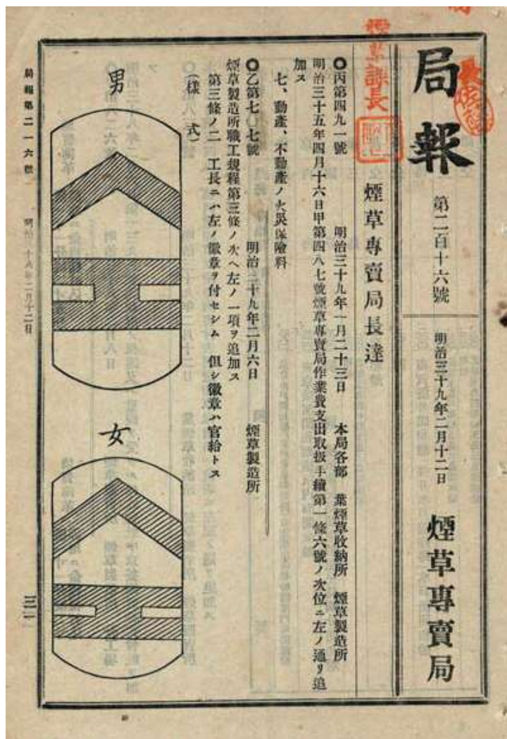
圖 11-3 大藏省專賣局局報第二百十六號 來源：大藏省專賣局局報 日期：明治 39（1906）年 2 月 12 日

腦事務局、煙草專賣局及鹽務局之業務為一全新的「專賣局」，主管煙草、鹽、樟腦及樟腦油之專賣事業，下設收納部、販賣部、製造部、計理部，並於全國各地設置收納