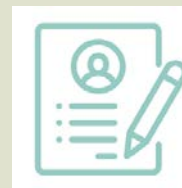
●2.紙本流程： 印出申請單後簽名 傳遞至本館閱覽室