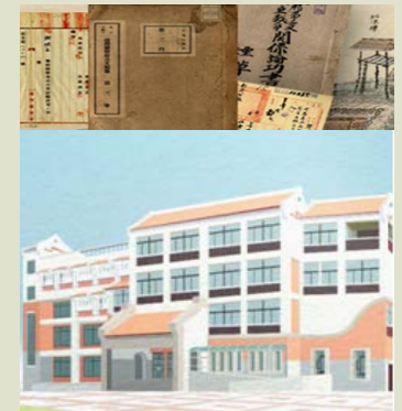
●通知後到館閱覽 需攜帶身分證明文件 (或代辦人委託書)